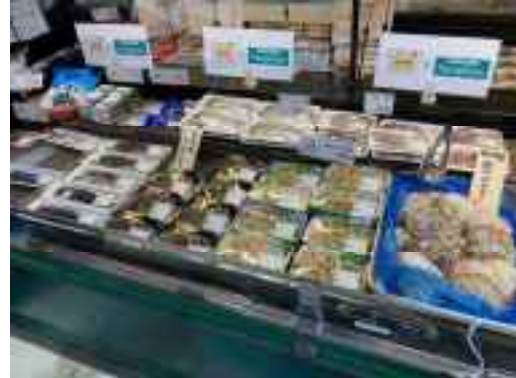
太田房江 前経済産業副大臣が視察

AJS 会員各社において、秋口から大型フェアを企画中の企業もあり、今後も様々な企業でフェアの展開が予定されています。