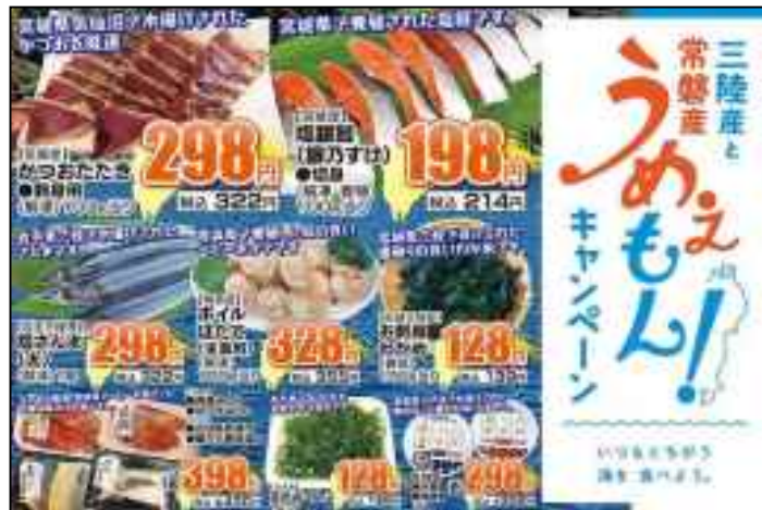
10/3-4 八幡屋店 キャンペーンチラシ